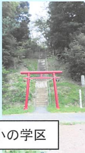
かつての北辺田小の学区