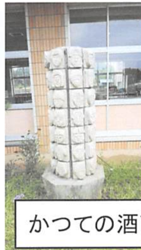
かつての酒直小の学区