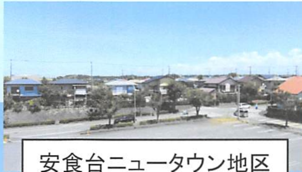
安食台ニュータウン地区